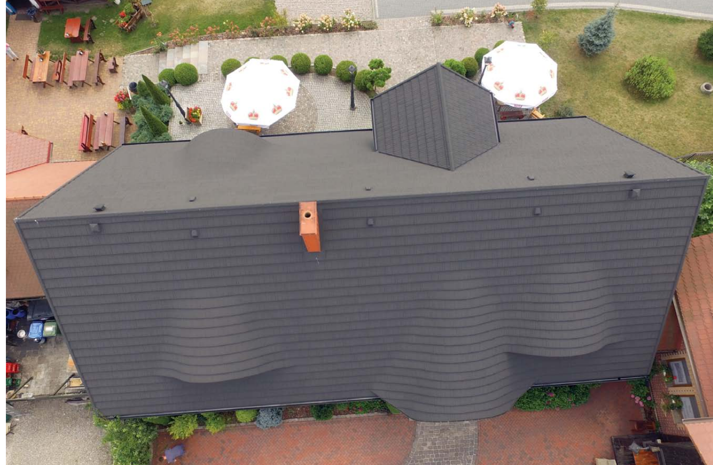
Hilary Gościeniec dla Przyjaciół mieści się w miejscowości Wyczechowo przy drodze krajowej nr 20 między Gdańskiem a Kościerzyną. Po 10 latach gont osikowy przestał spełniać swoje zadanie i został wymieniony na gont blaszany TILCOR SHAKE CHARCOAL.

Inwestor zdecydował się na przykrycie swojej karczmy nowozelandzką blachodachówką z posypką mineralną TILCOR SHAKE do złudzenia przypominającą gont drewniany. Jak mówi przekonano go wiele zalet jakie